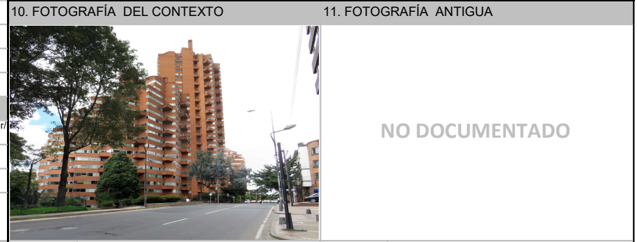
Fuente: Equipo Fotografía PEMP Patrimonio Inmueble Fuente: No documentado